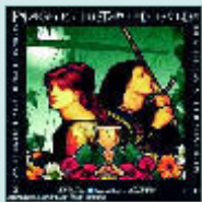
Richard Wagner: „Tristan und Isolde“. Runnicles (Warner).