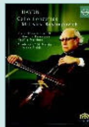
Joseph Haydn: „Cello Konzerte“, Rostropowitsch (Unitel).

Hayden im Rausch der Schönheit. Er hat die Renaissance des Cellos begründet: Mstislaw Rostropowitsch ist der Peter Ustinov der Musik – ein alter, weiser Herr des Klanges. Inzwischen hat er sich zurückgezogen, widmet sich der Nachwuchsförderung und dirigiert. Dass er das kann ist nun auf einer DVD zu sehen, auf der Rostropowitsch Haydns Cello-Konzerte spielt. Natürlich dirigiert er – en passant – die Academy of St Martin in the Fields. Die Aufnahme ist eine Dokumentation des perfekten alten Klanges. Es ging in dieser Zeit, die Aufnahmen stammen aus dem Jahre 1975, noch nicht wirklich um die Erkenntnisse der historischen Aufführungspraxis, sondern viel eher um die Suche nach dem Schönen. Hinter einer technisch polierten Oberfläche ohne Makel lässt er musikalische Innigkeit hören. Eine Ästhetik, in der es nichts Störendes gibt. Aus der historischen Distanz klingt das fast ein bisschen zu schön – aber damals war die Welt ja auch noch in Ordnung.