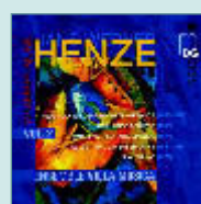
Hans Werner Henze: „Chamber Music, Vol. 2“, Ensemble Villa Musica (MDG Gold)

Entstanden ist eine leise und eindringliche Musik, die ein melancholisches Landschaftsbild erzeugen möchte, das einem Traum oder einer schmerzlichen Erinnerung gleichkommt. Die Musik zu „Der junge Törless“ wurde von Henze für den Film von Volker Schlöndorff komponiert. Die hohen spieltechnischen Anforderungen der Kompositionen bewältigt das Ensemble Villa Musica virtuos.