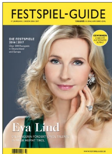
die hochwertige Premium-Ausgabe