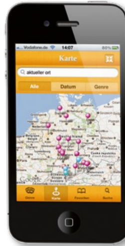
die mobile iPhone-App