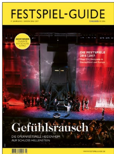
die hochauflagige Standardausgabe