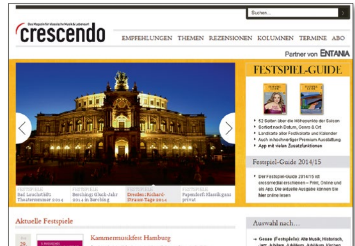
das Festspielportal www.festspielguide.de

Der crescendo -Festspiel-Guide ist seit 18 Jahren DIE Plattform für Festspiele und Festivals. Bewährt und reichweitenstark. Erfolgreich auf allen Kanälen: Print, Online und Mobile.